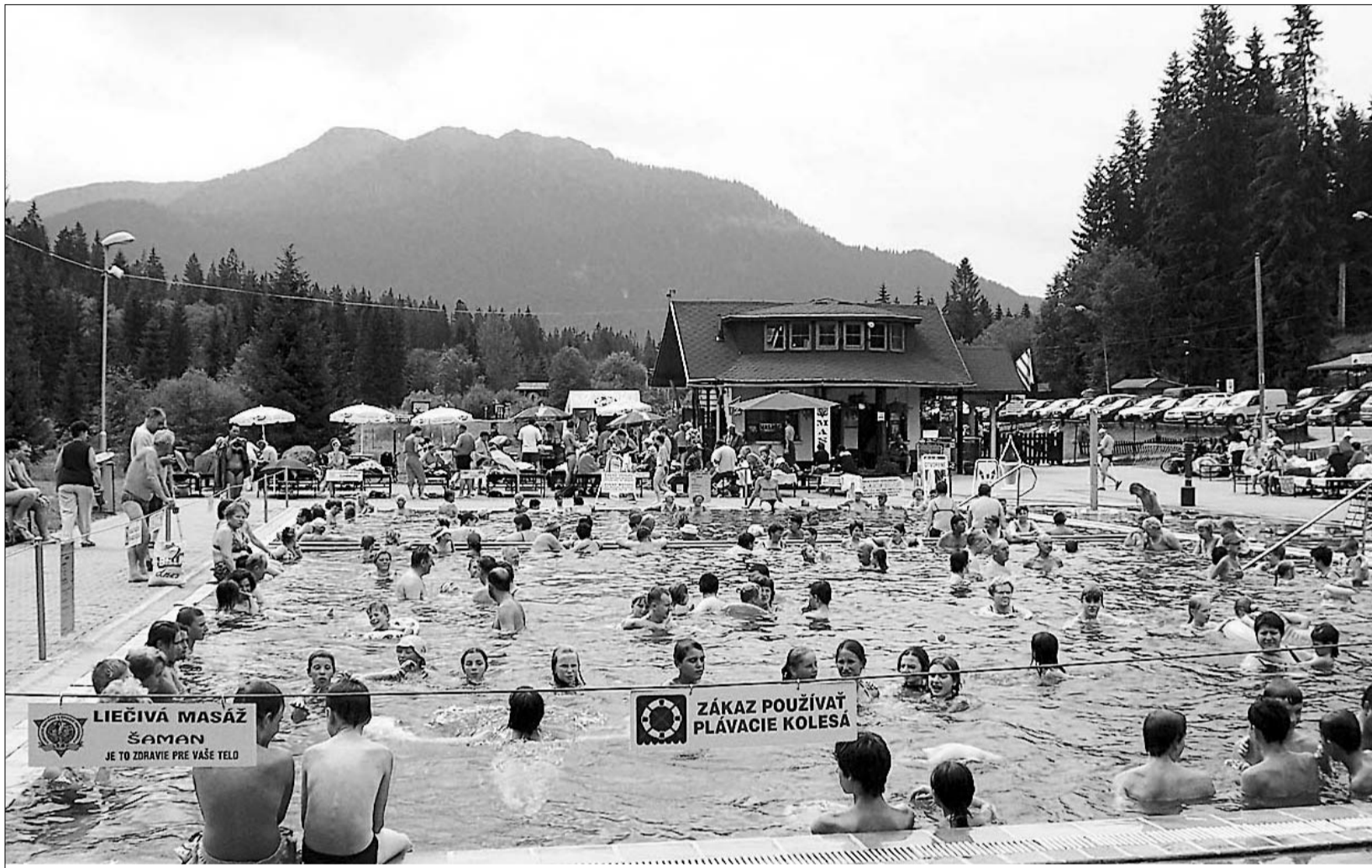
Baseny wypełnione są wysokozmineralizowaną wodą, która zawiera związki wielu życiodajnych pierwiastków, w tym znaczne ilości magnezu.

Rodzinny wyjazd do naszych południowych sąsiadów – Słowacji – można z powodzeniem nazwać wyprawą po zdrowie. Ogromna ilość wód mineralnych i naturalnych kąpielisk czynią ten kraj rajem dla żądnych kąpiei i zabaw w wodzie miłośników leniuchowania.